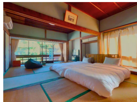
客室一例/俵山まちごと旅館 京や