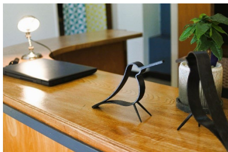
受付は旧外湯「川の湯」を改装した施設に設置